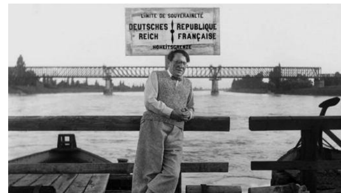
Exposition René Schickele du 22 septembre au 21 novembre